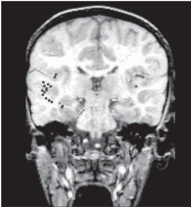
Figura 2. Técnica MSI (RM+MEG) en corte coronal en un niño diestro con síndrome de savant . Se somete durante el estudio MEG a estimulación lingüística en modalidad auditiva, mediante una tarea verbal de reconocimiento continuo. Se observa la diferencia dipolar hemisférica derecha en áreas del lenguaje.

escultura; como si tuviera conocimientos de anatomía, reproduce músculos y fibras exactamente como las ve. Sus producciones de estatuillas en bronce se han hecho famosas y se cotizan en el mundo del arte.